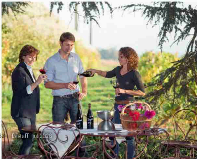
»Château Thivin« zählt zu den traditionsreichsten Gütern im Cru Côte de Brouilly. Die Familie Geoffroy führt das Weingut in sechster Generation.

Das Beaujolais wurde Opfer seines eigenen Erfolgs. Vor allem mit dem jungen Wein Nouveau, um den sich ab den 1970er-Jahren ein globales Spektakel entwickelte. Restaurants von New York bis Castrop-Rauxel stellten Tafeln mit »Le Beaujolais Nouveau est arrivé« vor die Tür. In einem irren Rennen wurde der erste junge Wein am dritten Donnerstag im November sogar mit der Concorde ausgeliefert. Ex-