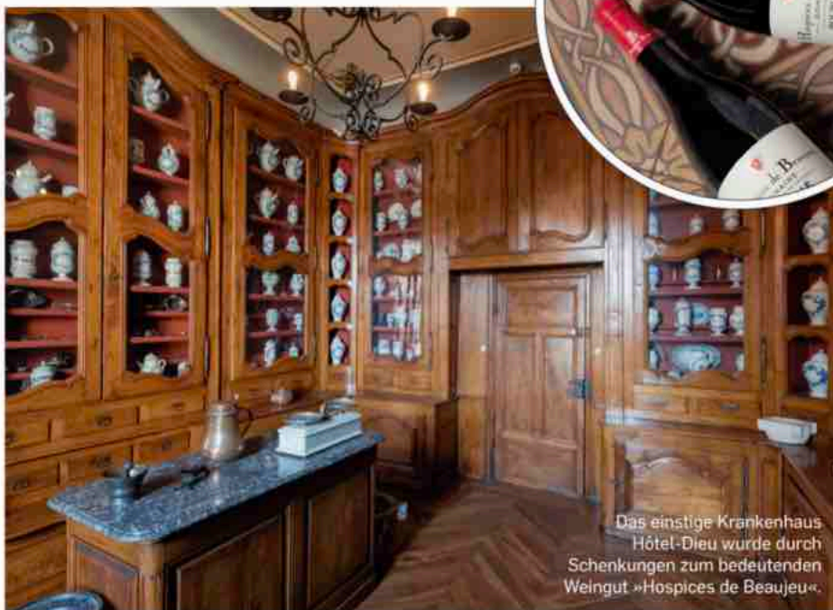
Das einstige Krankenhaus Hôtel-Dieu wurde durch Schenkungen zum bedeutenden Weingut »Hospices de Beaujeu«.

liegt wunderbar ruhig zwischen Weinbergen und alten Bäumen im Herzen des Beaujolais. Das Haus