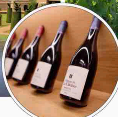
Château de la Chaize wird zu Recht als Versailles des Beaujolais bezeichnet.