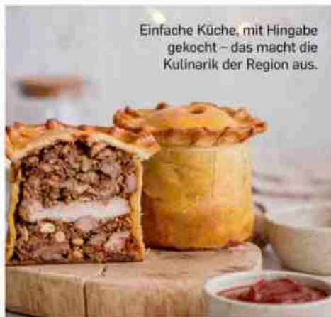
Einfache Küche, mit Hingabe gekocht – das macht die Kulinarik der Region aus.

Typisch für die Region ist die sogenannte »semi-carbonique«-Vergärung: Die ganzen Trauben werden ganz oder teilweise mitsamt dem Stilgerüst vergoren. In den unverletzten Beeren entstehen dabei besonders expressive Fruchtaromen. Gleichzeitig bringt das Stilgerüst Struktur in die Weine. Neues Holz spielt hier keine Rolle. Statt Kraft und Extraktion sucht man Trinkfluss. »Gamay ist die perfekte Rebsorte, wenn man puren Wein machen will – ohne neues Holz und Überextraktion«, erklärt Louis-Claude Desvignes.