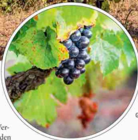
Entscheidend sind die kargen Granit- und Vulkanböden der Crus – sie zähmen den Gamay.