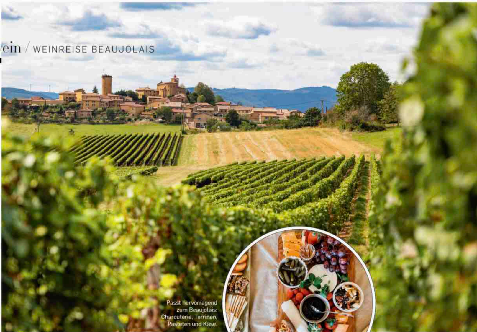
Passt hervorragend zum Beaujolais: Charcuterie, Terrinen, Pasteten und Käse.