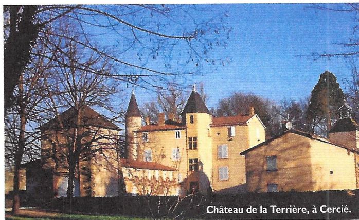
Château de la Terrière, à Cercié.