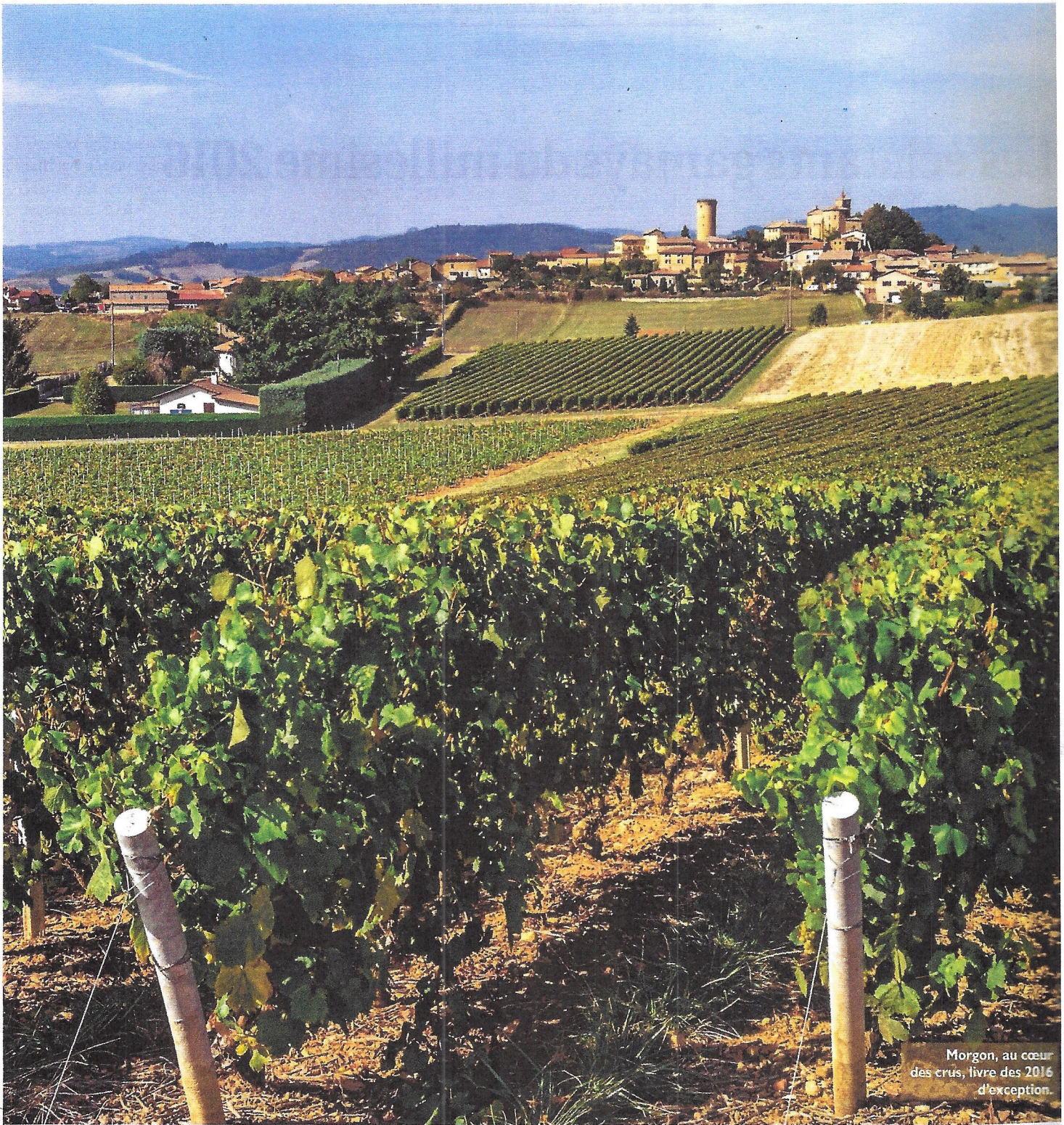
Morgon, au cœur des crus, livre des 2016 d'exception.